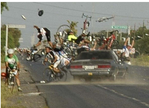
Co by nemělo nastat