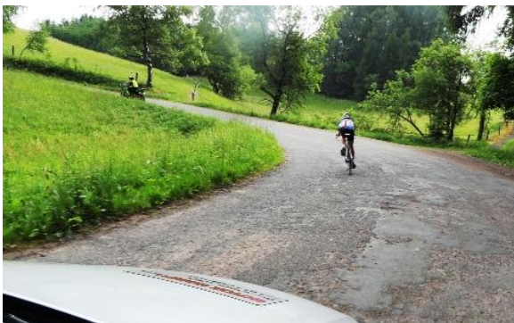
Dodržovat odstup od závodníků