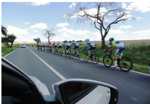
Typické situace pro únik